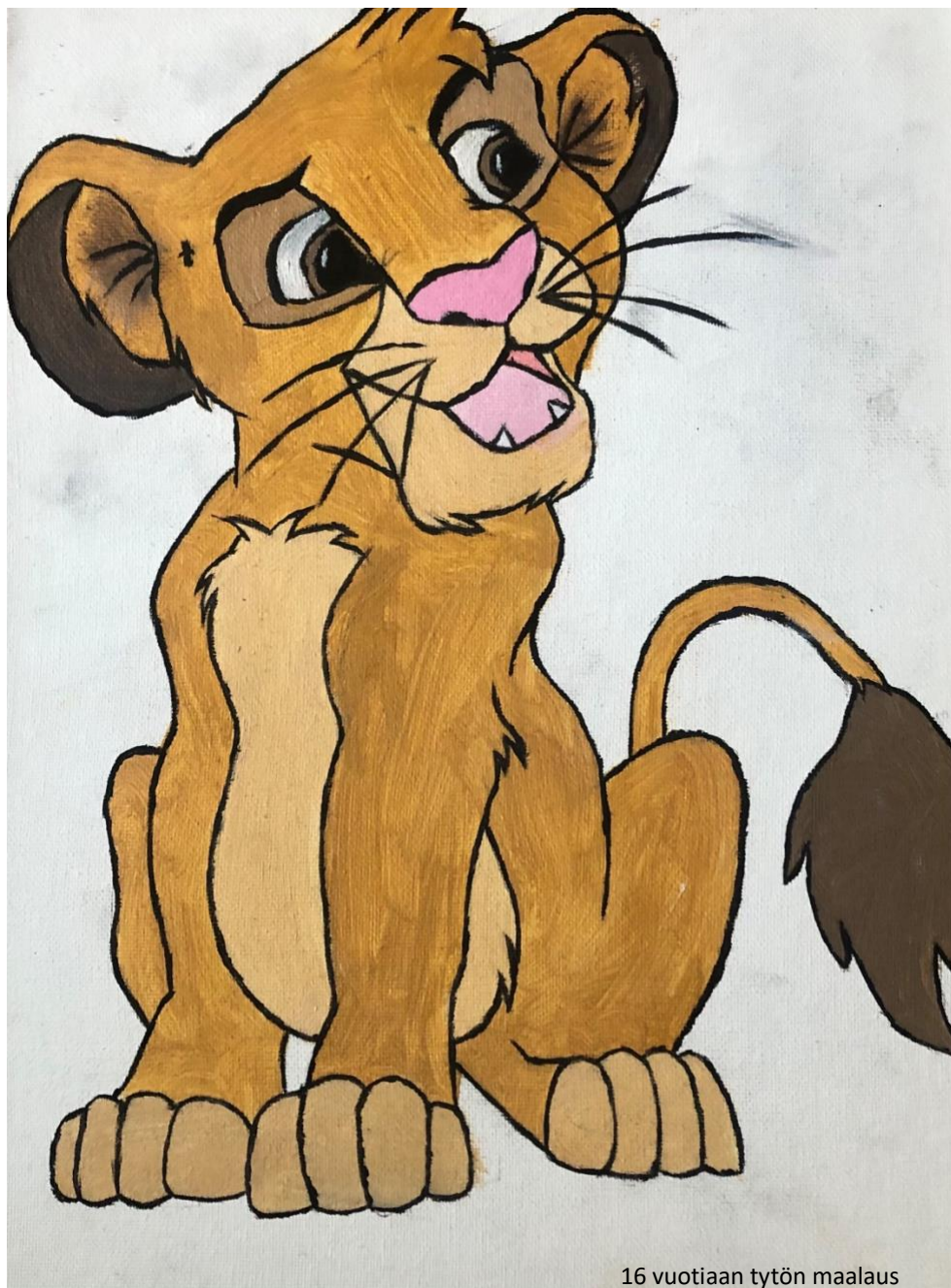
16 vuotiaan tytön maalaus